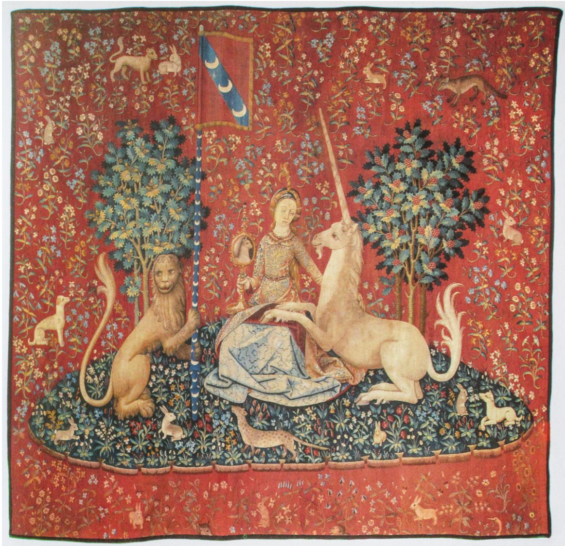
Dame à la Licorne, Musée de Cluny, Paris

Eine ganze Fülle von Details wird uns bereits im relativ kurzen Betrachten der einzelnen Teppiche entgegentreten und uns an verschiedene psychologische Stufen der Individuation erinnern.