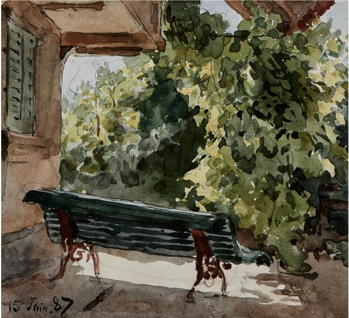
«Gartenbank vor dem Haus, 1887»,