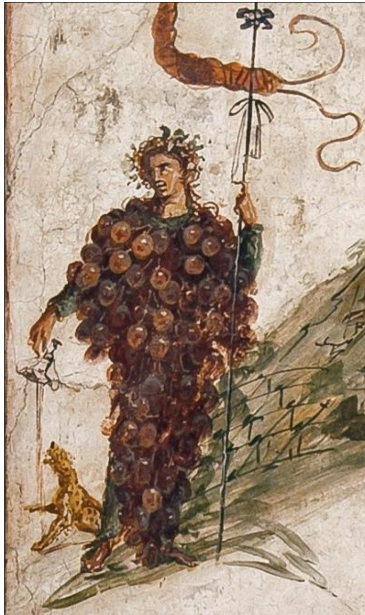
Dionysus the grape – House of the Centenary, Pompeii