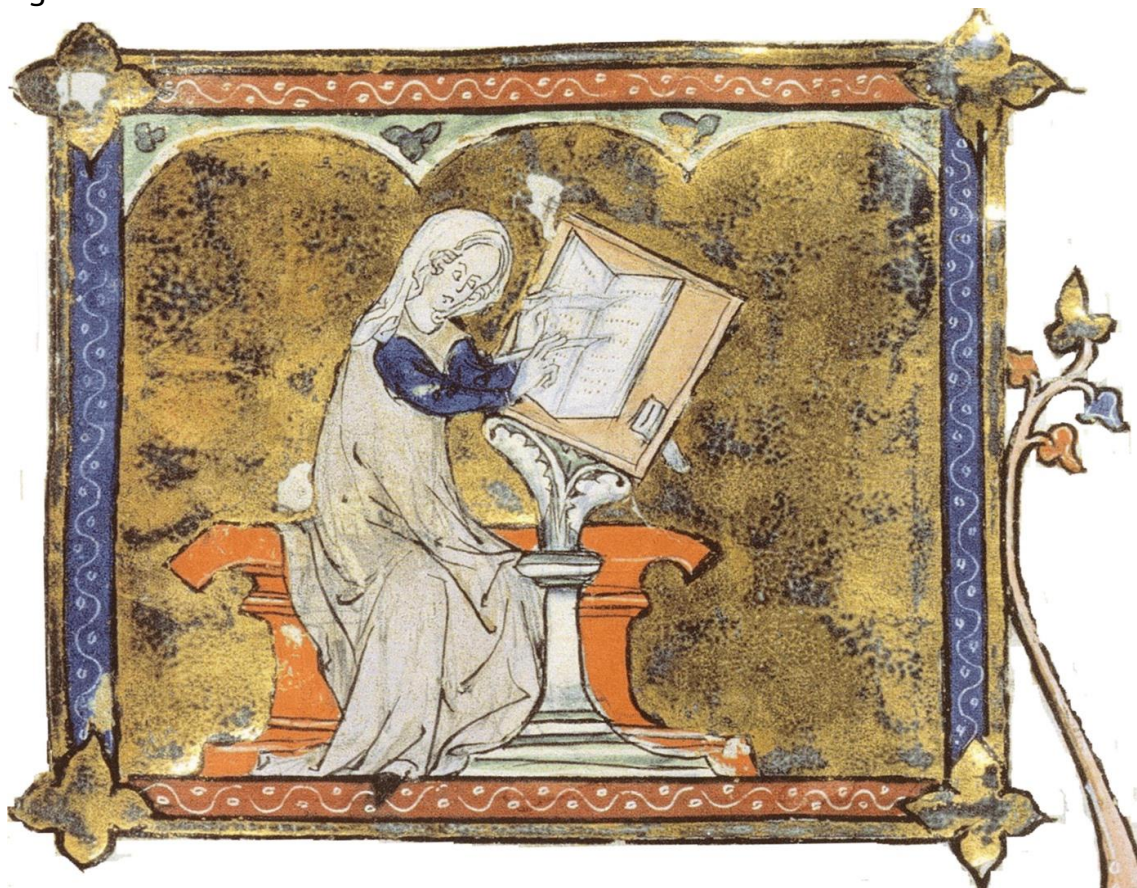
Marie de France, Buchmalerei um 1280-1290 (Paris, BnF, Bibliothèque de l'Arsenal, manuscrit 3142 fol. 256)

Die Lysis des Lais hat mich sehr berührt. Marie de France hat das literarische Mittel der Geschichte in der Geschichte verwendet, um zu betonen, wie bedeutsam das menschliche Leiden an einer unerfüllt gebliebenen Liebe ist. Am Schluss lässt sie die zwei Hauptfiguren miteinander diskutieren, welchen Titel die Geschichte denn haben soll. Bei aller Ernsthaftigkeit des Themas scheint hier ein liebevoller Humor durch. Er ist so wichtig auf unserem Weg der Individuation.